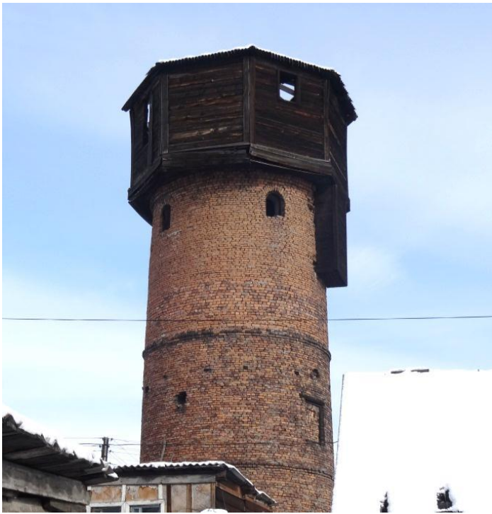
Хороша будет смотровая площадка для турбюро на Водонапорной башне вблизи берега Минусы