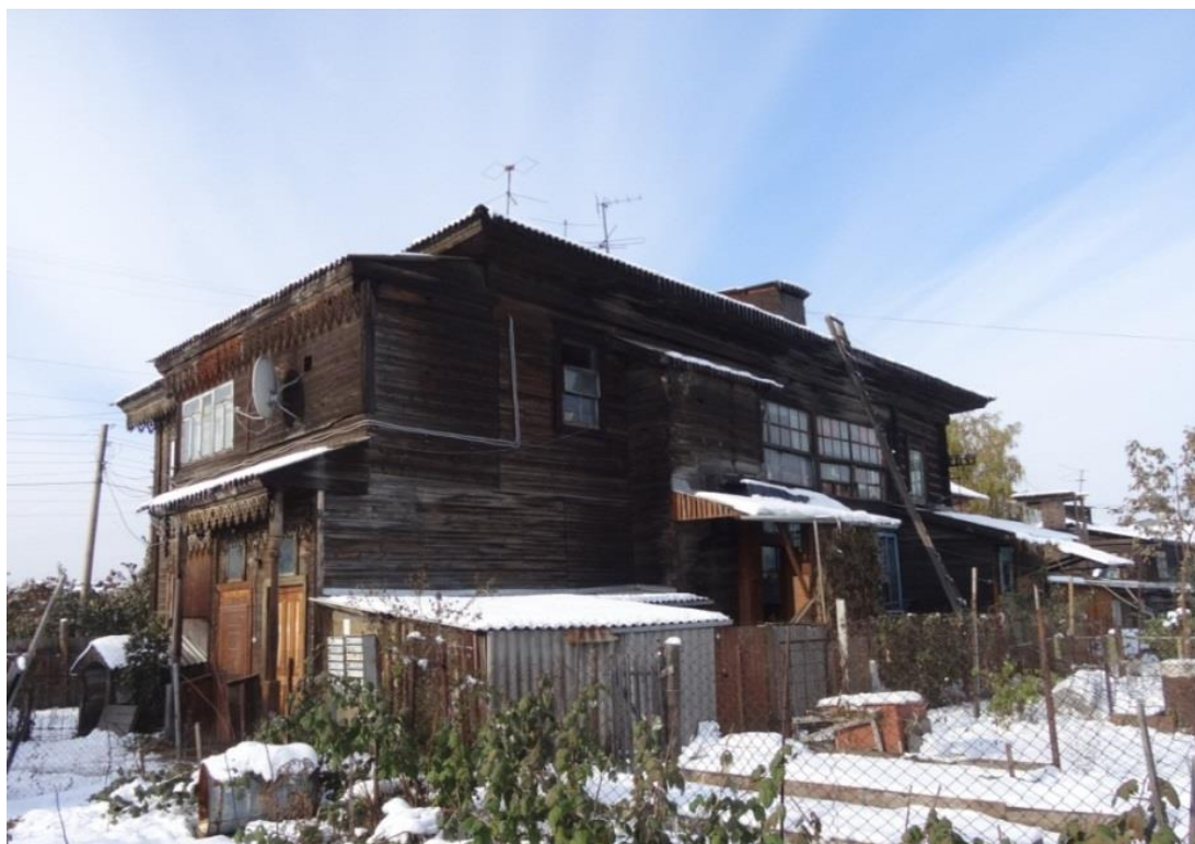
Вид северных дворовых прирубов