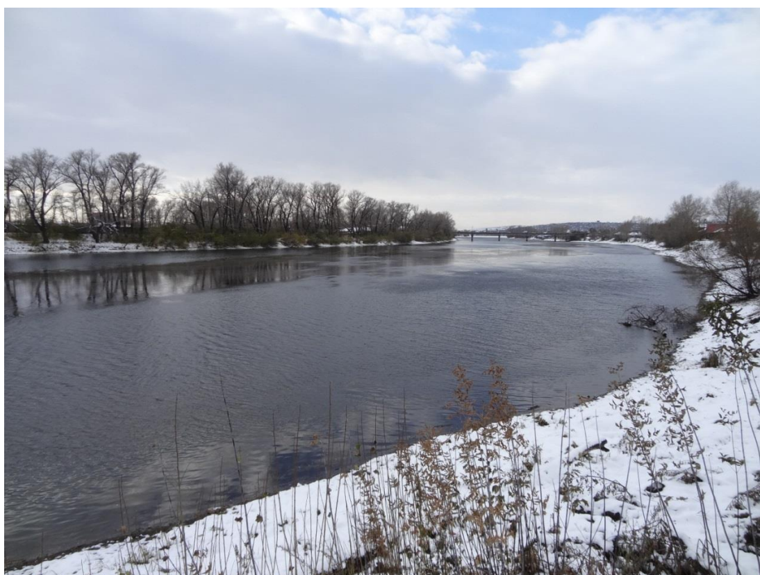
Вид на запад (октябрь, 2016 г.)