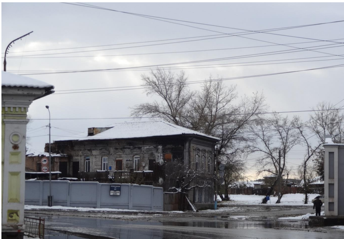
Вечерний вид от Соборной площади на запад