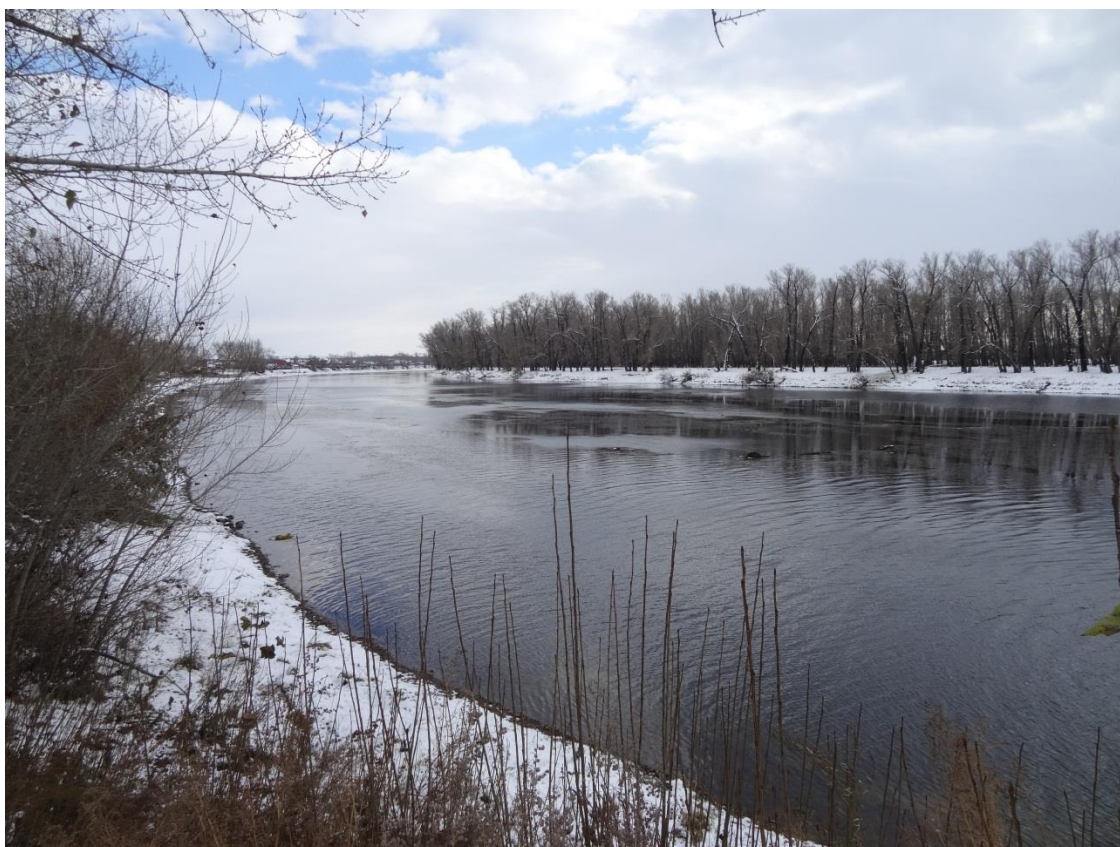
Вид на восточную излучину – фотографии октября 2016г. Л.М. Сергеевой

Необходимо создание зоны охраняемого природного ландшафта вдоль протоки и реки Минусы по двум берегам – на протяжении исторической части города, с двух сторон от моста.