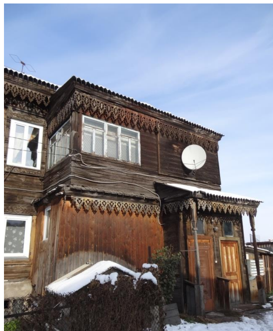
Жилой дом двухэтажный XIX века, на каменном подклете с двумя галереями и крыльцом на резных колонках по ул. Октябрьской, 93