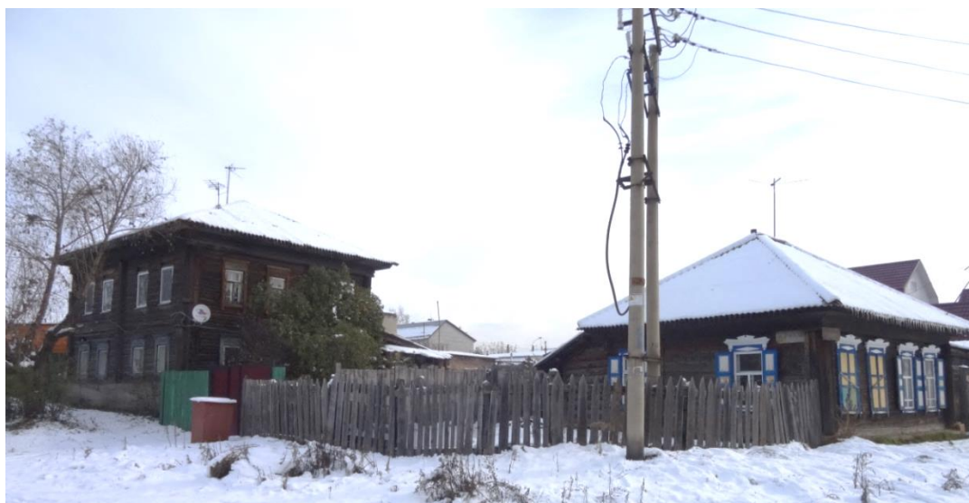
Как дом по Набережной, 72/ул. Затубинской с резными солнцами очелий