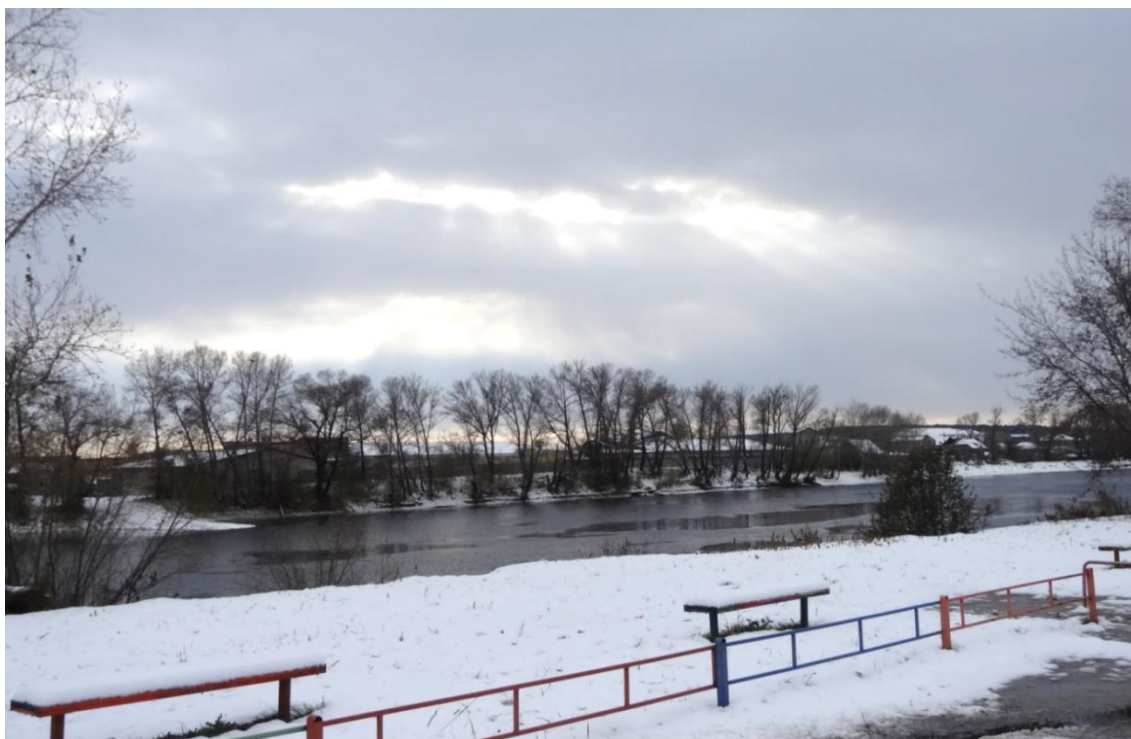
Зона охраняемого природного ландшафта набережной реки Минусы с западной стороны от моста через протоку Минусы (фото Л.М. Сергеевой, 14 октября 2016г.)