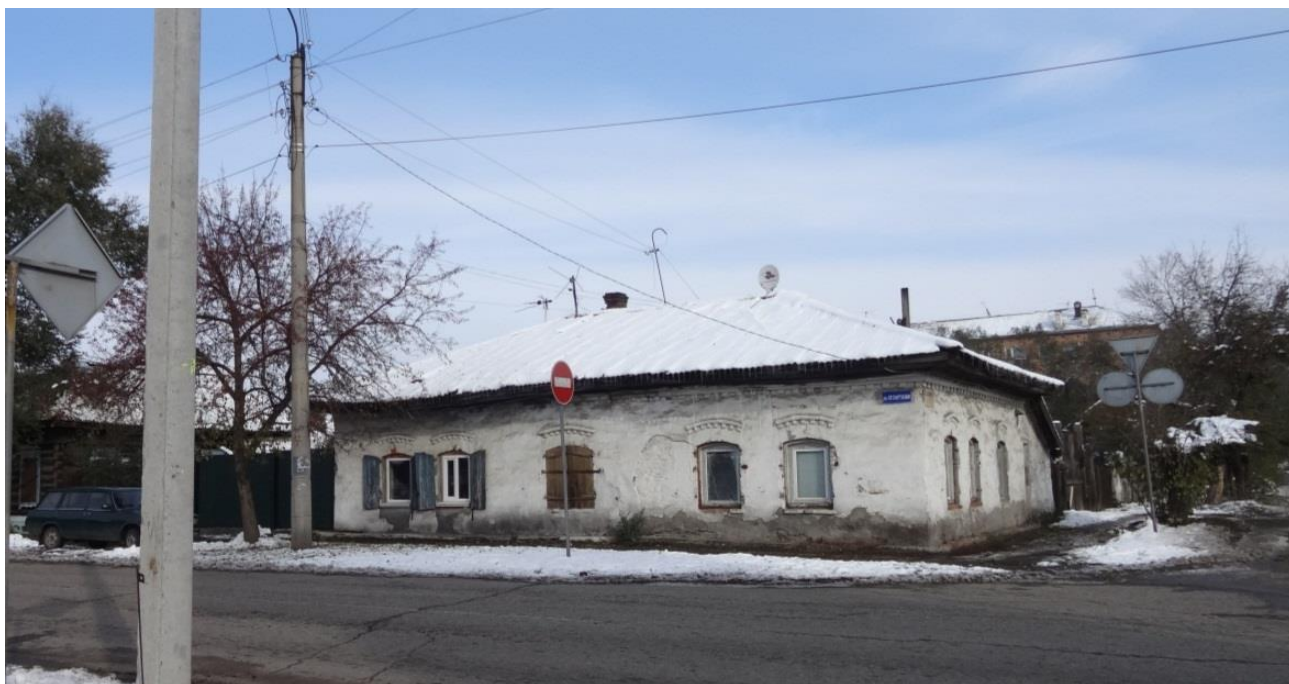
Старинный дом по ул. Красных партизан, 11-а/Кравченко, 3

5. Усадьба XIX века с традиционным минусинским домом, 2-х эт. флигелем с резной галереей, с террасой и бутовыми кладовыми – по ул. Набережная, 38; (5, 6 и 7 позиции списка – комплекс старинной застройки вдоль западной стороны набережной Минусы);