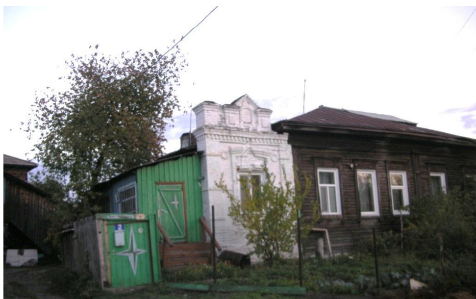
Вид дома со светёлкой на набережной со стороны ул. Мартьянова, 2